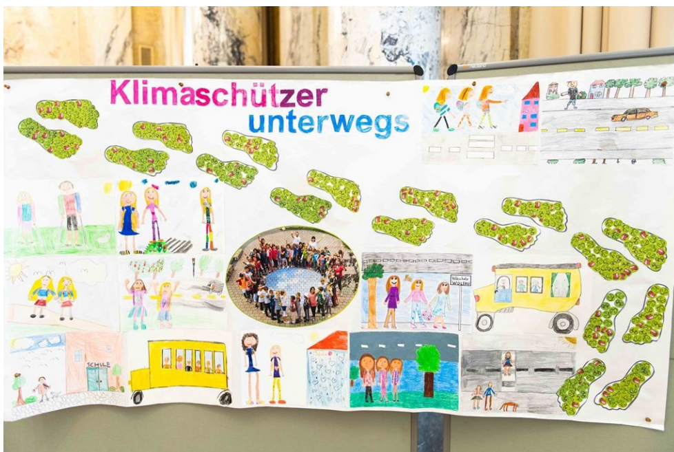
Plakat: VS Wolfau