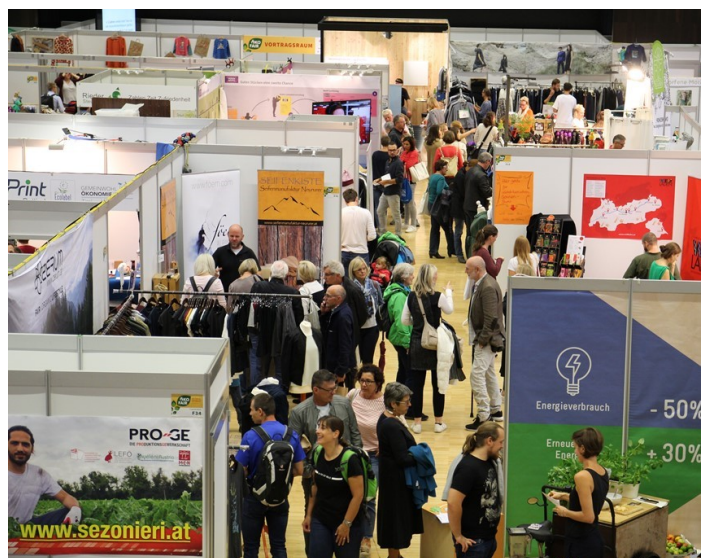
Congress Messe Innsbruck